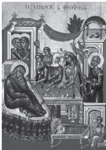
Η ΓΕΝΝΗΣΙΣ ΤΗΣ ΘΕΟΤΟΚΟΥ