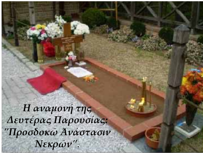
Η αναμονή της Δευτέρας Παρουσίας: "Προσδοκῶ Ἀνάστασιν Νεκρῶν".

686). Πνεύμονες της ζωής μας είναι τα δάση. Πνεύμονες της ψυχής μας είναι τα λείψανα. Η ταφή στη γη θα μας φανερώσει όχι μόνο τα λείψανα των προσφιλών μας και τα σημεία του Θεού πάνω σ' αυτά, αλλά και τα άγια λείψανα των αγίων ανθρώπων του Θεού. Αν είχε ισχύσει η καύση των νεκρών δεν θα είχαμε οι πιστοί τόσα θαυματόβρυτα άγια λείψανα.