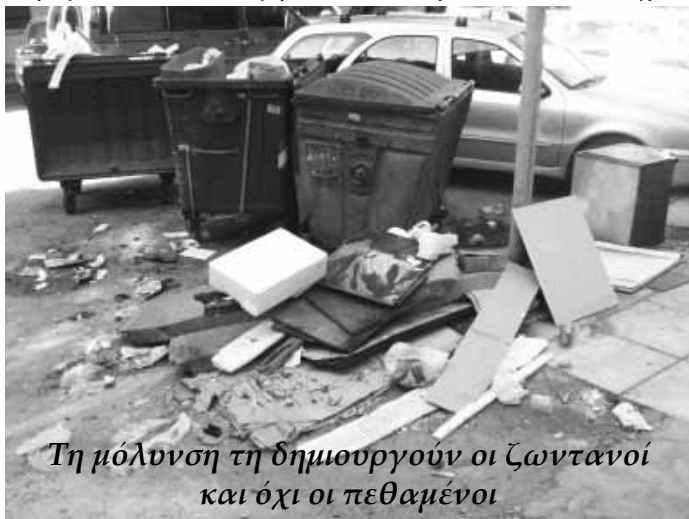
Τη μόλυνση τη δημιουργούν οι ζωντανοί και όχι οι πεθαμένοι

δύσκολη εικόνα. Βλέπεις το οικείο πρόσωπό σου δίχως πνοή, δίχως ζωή, για τελευταία φορά, να κατεβαίνει στα σπλά-