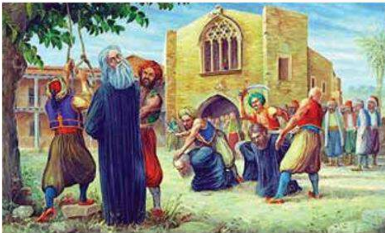
Ο απαγχονισμός του αρχιεπισκόπου Κυπριανού

Στην Κύπρο δρα ο Ηπειρώτης γιατρός Δημήτριος Ύπάτρος και μεί στη Φιλική Εταιρεία τον αρχιεπίσκοπο Κυπριανό και άλλους κληρικούς και προκρίτους του νησιού. Ο αρχιεπίσκοπος υπόσχεται οικονομική βοήθεια όχι όμως και επανάσταση στην Κύπρο, γιατί κάτι τέτοιο θα ήταν καταστροφικό. Στα έγγραφα φαίνεται πως τα χρήματα προορίζονται για την ανέγερση σχολείου στην Πελοπόννησο (έτσι αποκαλείται συνθηματικά η Επανάσταση). Ο διοικητής της Κύπρου Κιουτσούκ Μεχμέτ αντιλαμβάνεται την κίνηση και εισηγείται στον σουλτάνο την εκτέλεση 486 κληρικών και λαϊκών. Πράγματι, ο σουλτάνος δίνει την έγκρισή του και ο Κιουτσούκ Μεχμέτ δίνει την εντύπωση ότι καταστέλλει την επανάσταση στην πραγματικότητα όμως βρίσκει την ευκαιρία για να επιδοθεί σε ένα όργιο αυθαιρεσίας: αρπάζει περιουσίες,