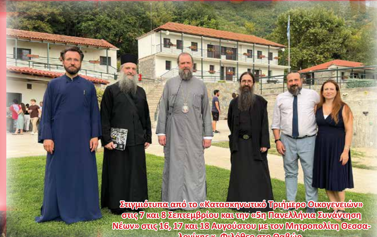
Στιγμιότυπα από το «Κατασκηνωτικό Τριήμερο Οικογενειών» στις 7 και 8 Σεπτεμβρίου και την «5η Πανελλήνια Συνάντηση Νέων» στις 16, 17 και 18 Αυγούστου με τον Μητροπολίτη Θεσσαλονίκης κ. Φιλόθεο στο Θαβάρ.