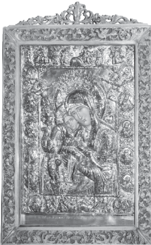
Η ΕΙΚΟΝΑ “ΑΞΙΟΝ ΕΣΤΙΝ” ΤΟΥ ΙΕΡΟΥ ΜΑΣ ΝΑΟΥ